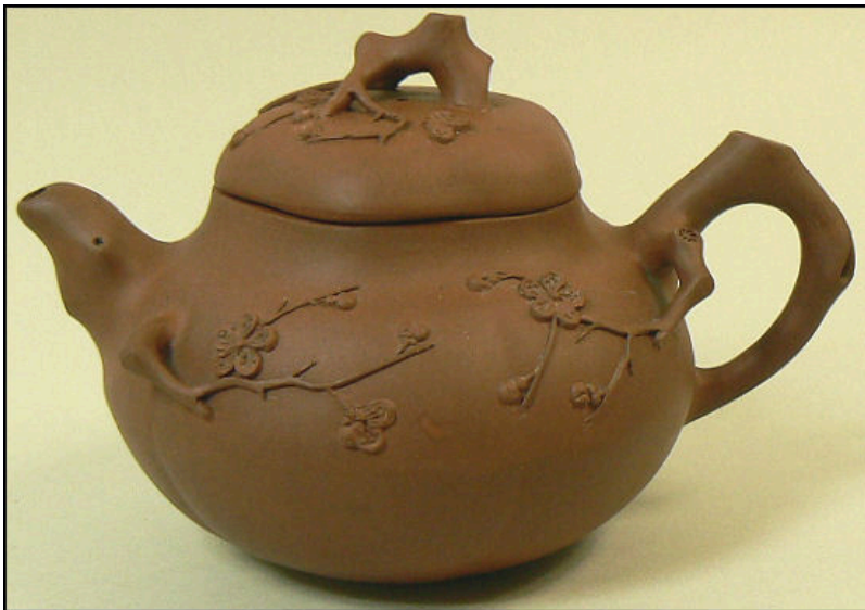
Ấm có trang trí hình cành mai